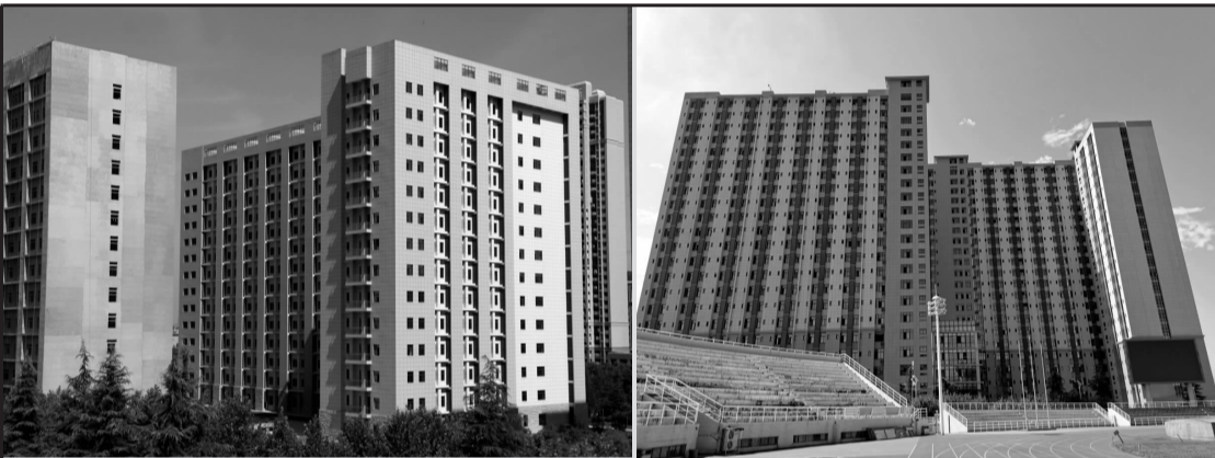
本报讯 暑假期间,我校长安校区生命科学类实验教学楼(左图)和博士研究生公寓分别通过竣工验收。

双选会前期,学生就业创业指导服务中心通过“西北大学就创中心”网站、“西大就业创业”微信平台、毕业生就业联络群等渠道向用人单位和毕业生发布空中双选会邀请函、参会操作指南,双选会具体安排和用人单位参会录等通知公告,保障本次空中双选会顺利举行。(就业创业指导服务中心)