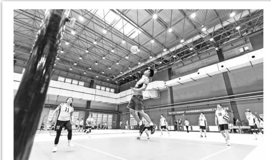
本报讯 5月15日至16日，由省教科文卫体工会主办、我校工会承办的2026年“建功十五五 奋进新征程”职工气排球友谊赛在我校长安校区举办。省总工会副主席、党组成员王永岗，省教科文卫体工会副主席王薇，我校党委副书记赵超组出席比赛。省内8所高校组队参赛，队员精神饱满、配合默契，以精彩的表现赢得阵阵喝彩。经过一天半的激烈比拼，我校和西安建筑科技大学、陕西国防工业职业技术学院、西安交通大学分别获得前四名。(校工会)

往西安话剧院·新城剧场观看话剧《共产党宣言》。演出开始前，西北大学“红色基因”党员宣讲团围绕《共产党宣言》的时代价值、精神内涵及创作背景开展微宣讲，帮助大家深刻领悟原著精髓。观演结束后，师生在西安话剧院内分组开展研读，围绕《共产党宣言》核心要义及观演感悟交流心得，在思想碰撞中深化理论认知、凝聚奋进共识。(生命科学学院)