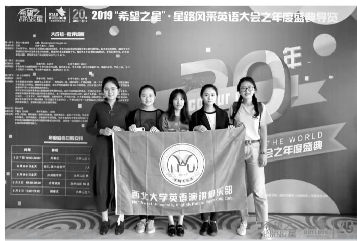
本报讯 日前,2019年“希望之星”全国英语风采大赛年度盛典在北京落下帷幕,经过四轮的比赛较量,我校最终获得一等奖2项,二等奖1项,三等奖1项。本届比赛中我校共有5人进入全国总决赛,占陕西省大组进入国赛十强选手半数。(教务处)

命题,加强对监考人员的培训工作,强化责任意识,提高业务能力,加强对学生的考前教育工作,防患于未然;二是要加强招生宣传和校园开放日的筹备工作。校园开放日首次在我校博物馆举行,各单位要高度重视,认真准备、提前预演,确保宣传工作的高质量和高度的安全性,提升家长和学生参观咨询的体验度和满意度,吸引