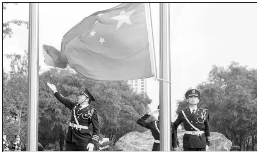
本报讯 10月1日早8时，我校在长安校区中心广场举行升旗仪式，西北大学国旗护卫队担任了升旗任务。各院系师生代表、团组织代表到场参加，部分小学、退伍学生以及校外师生和家属自发前来观礼，共同庆祝中华人民共和国成立72周年。冉冉升起的五星红旗在风中飘扬，坚定了师生们爱党爱国的决心。(向琳)