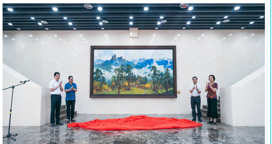
为迎接我校120周年华诞，中国西部发展研究中心书画院的艺术家们为学校创作和捐赠了油画《秦岭云海》。油画《秦岭云海》长4.6m，宽2.3m，由八位创作者历时16小时精心绘就。油画以大秦岭为背景，象征着西北大学在陕西这片沃土、大秦岭脚下玉汝于成，画中山峦叠嶂高耸入云霄寓意着西北大学在攀登科技高峰、创办一流大学中的拼搏精神和崇高理想；主画面中12棵青松寓意着西北大学120年奋楫笃行的辉煌历程，蓝天下的层林尽染代表着西北大学春华秋实、桃李天下的巨大成就。（图/刘杰）