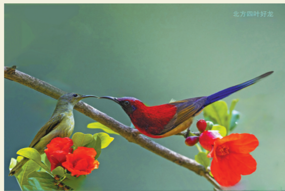
石榴花上的太阳鸟