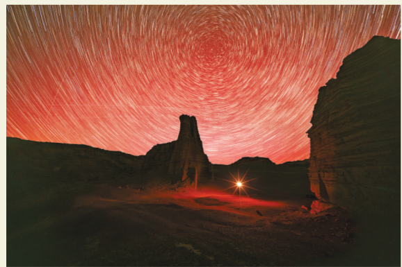
地磁暴·红极光·星轨