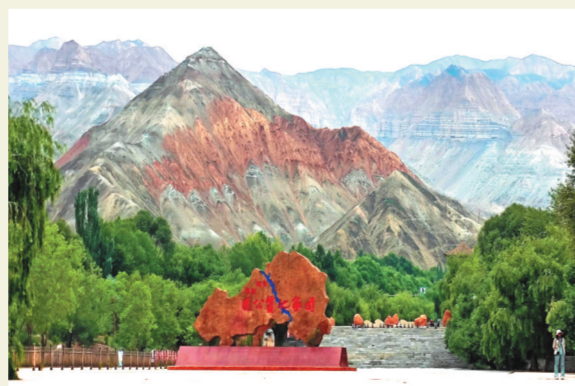
青海贵德国家地质公园