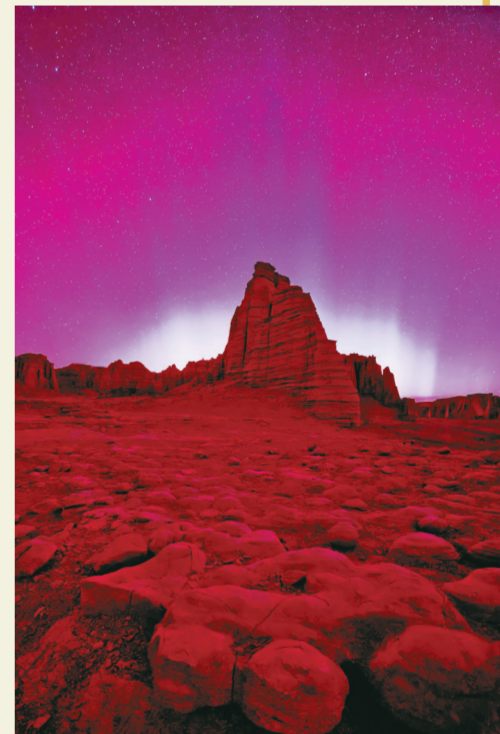
红色极光映照天际