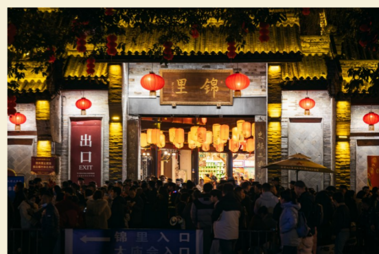
李康康 刘泽开 钱舟 张程纯 摄影 马 赛 曾冰玲 陈添翼