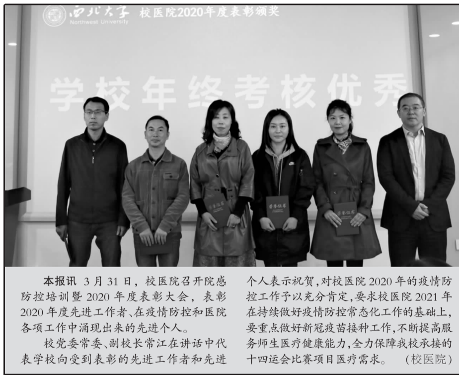
校医院2020年度表彰颁奖大会，表彰2020年度先进工作者、在疫情防控工作中涌现出来的先进个人。