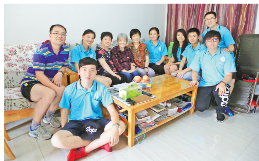
西大师生看望、采访龚全珍（后排左四）

上述这些活动的深入开展，出版物的相继问世，使全校师生对龚全珍的光辉事迹与高尚精神有了更为全面的了解与更加深刻的感悟。2017年7月，西北大学的5位学生工作干部在井冈山学习期间，专程前往莲花县，探望了龚全珍。2019年5月，龚全珍老校友因眼疾做了一次手术，学校闻讯后专门致信老人，祝贺她手术成功，祝愿她顺利康复。2022年适逢西北大学120周年校庆，已经99岁高龄的龚全珍，虽然已不能像20年前那样回到母校参加校庆活动了，但是她对母校的关注与眷恋还是那么殷切。老人家欣然提笔写下了对母校百年校庆满腔热情倾注期望的寄语：“西北大学全体师生：希望