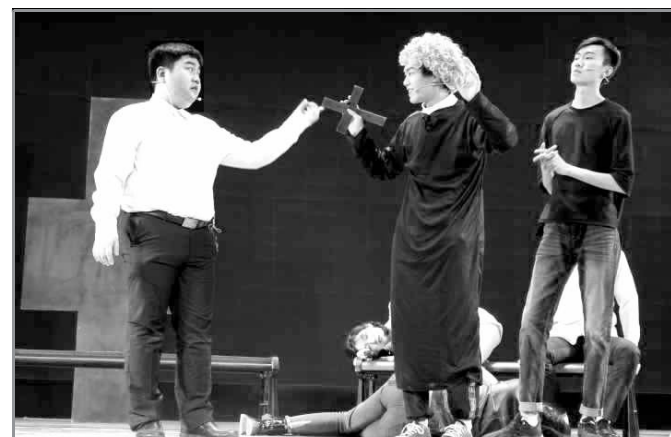
本报讯 2019“小黑小戏小剧本”于5月13日、5月18日晚七点在西北大学长安校区大学生活动中心举行，共展演了《乌龙山伯爵》《买买买》《青春禁忌游戏》三个剧目。(郭豪杰)