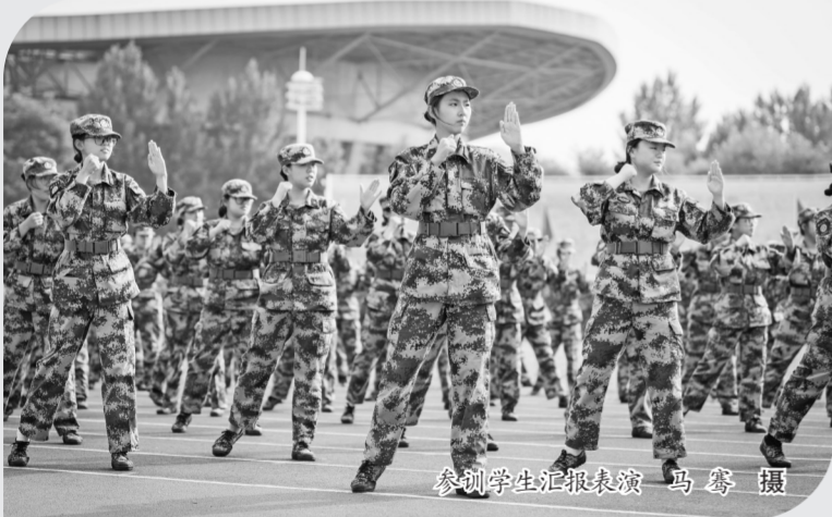
参训学生汇报表演

“全体都有,立正!稍息!今天,是军训的第二周,我们即将踏上拉练征程。这是对我们体能和意志的重大考验,希望大家拿出军人的气魄,勇往直前!”队伍前方,身着迷彩服的教官表情严肃,洪亮的指令刚刚发出,新生们雷鸣般的应答声回荡在训练场上。 拉练,是自8月29日开始军训以来,新生们迎来的一项重大考验。训练场上整装待发的萌新们,以笔直的身姿和昂扬的精神面貌,让人们感受到短短一周时间里,发生在他们身上的成长和蜕变。“双脚并拢,脚尖分开约60度,双手紧贴裤缝,抬头挺胸,目光坚定望向远方……”站军姿,无疑是磨砺新生意志力的第一道关卡。酷热的阳光毫无遮挡地倾洒而下,滚烫热浪中,汗水从同学们的额头滚落,流过眉毛,滑进眼睛,带来一阵刺痛。尽管表情痛苦,却没有一个人抬手擦汗。随着时间的推移,很多同学身体开始微微颤抖,但依然努力保持着标准的姿势。“基础训练虽然看似枯燥,但正是这些看似简单的动作,在不断地重复中锻炼着我们的意志力。”整整一天站军姿的基础练习下来,信息科学与技术学院(软件学院)的黄驿哲深有感触,“我会珍惜这段军训时光,踏实地走好每一步,努力向